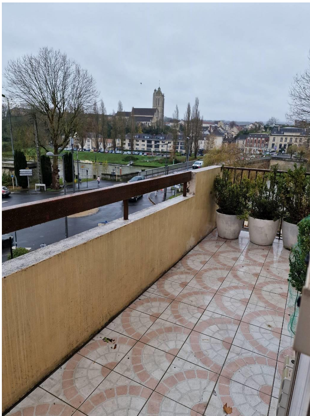
Balcon accessible par la cuisine et le séjour. Vue sur Beaumont sur Oise.