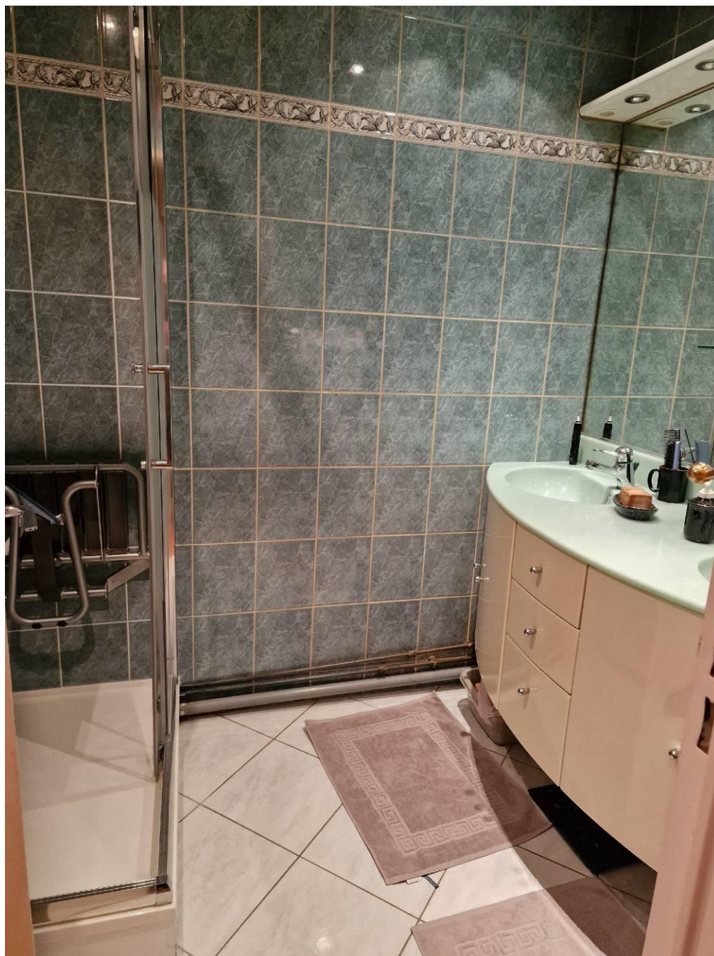
Salle de douche – vasques sur meuble