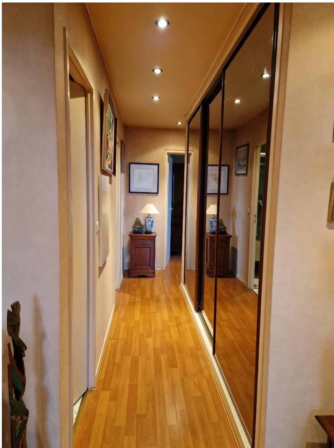
Couloir avec placards