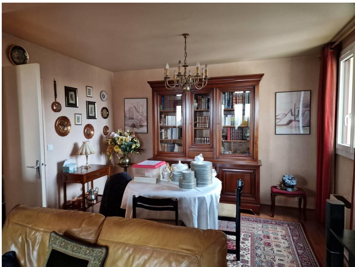
Séjour – salle à manger